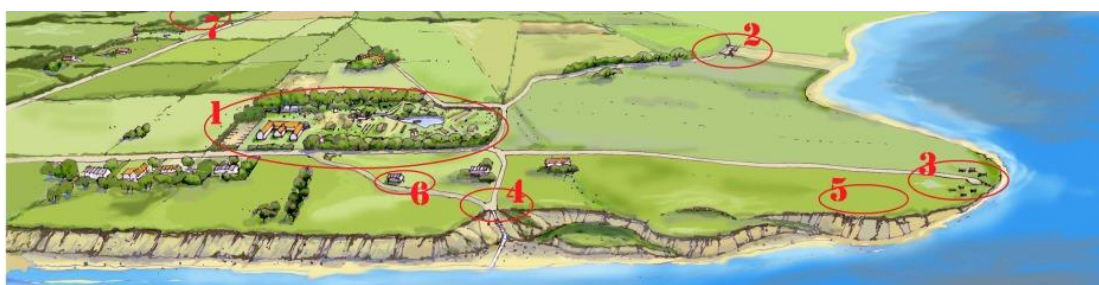
Stenaldercenter Ertebølle kan nu udvikles til at blive en ny turistmagnet i Vesthimmerland

Turismeudviklingen og tiltrækningen af gæster til kommunens kulturarvsseværdigheder er et af Vesthimmerlands Museums mest betydningsfulde indsatsområder. Fyrtårne er Aggersborg i nord, Stenaldercenter Ertebølle i vest og Per Kirkeby-museumsbygningen i Aars, hvorfra der koordineres turismefremmende tiltag til gavn for hele kommunen, såsom Kulturarvsmåned, dinturguide.dk (indviet 1. juni 2018) og stedbunden formidling i lokalområderne. Derudover består tætte samarbejdsrelationer til andre kulturarvsaktører i kommunen, såsom Johannes V. Jensen Museet, Nutidsmuseet, Museet Herregården Hessel, Vitskøl Kloster og de lokalhistoriske arkiver.