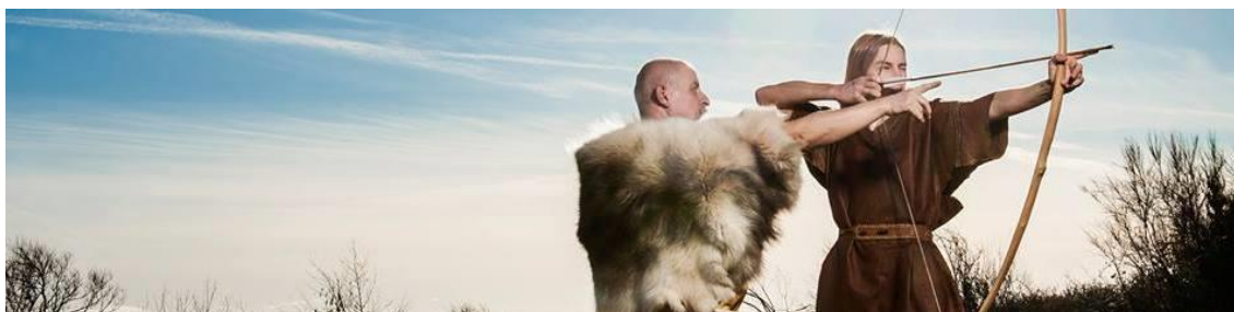
Stenaldercenter Ertebølle arbejder med alsidig, levende formidling og satser på tilgængelighed, bæredygtighed og biodiversitet

til Danmarks største og førende oplevelsescenter på området. På sigt kan byrådsbeslutningen fra 2012 om udviklingen af centret således indfries. Målsætningen er at skabe en stærk og attraktiv turistdestination og vidensbank, der kan markere sig både nationalt og internationalt. Udviklingsprojektets påbegyndelse i 2018 betød, at planlægningsarbejdet blev markant opprioriteret og formidlingsindsatsen tilsvarende reduceret. Det nye Stenaldercenter åbner den 15. juni 2019.