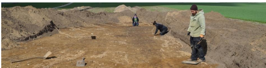
Vesthimmerlands Museums arkæologer har i 2018 arbejdet med 19 udgravninger og 16 forundersøgelser