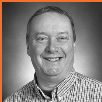
Broder Berg Museumsdirektør Vesthimmerlands Museum

Aggersborg i Vesthimmerland har sammen med de andre danske ringborge søgt om optagelse på UNESCOs prestigefyldte Verdensarvsliste.